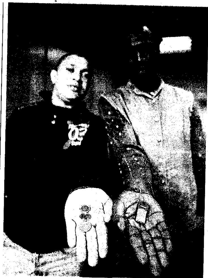
Due euro e cinquanta. Il bonus è l'unica fonte di reddito per i rifugiati che per legge non possono lavorare nei primi sei mesi del loro soggiorno

contributo in denaro da corrispondere a ogni beneficiario ed è destinato alle piccole spese personali». Ma soprattutto sottolinea che si tratta di: «uno strumento di supporto ai percorsi d'inserimento. Permette di acquisire maggior confidenza con la valuta e di testare direttamente il costo della vita». In pratica un bonus di due euro e cinquanta centesimi - unica fonte di reddito per i rifugiati che per legge non possono lavorare nei primi sei mesi del loro soggiorno - per rendere uomini e donne, perseguitati per ragioni politiche o religiose nei loro Paesi, «emancipati», «autonomi» nel far fronte alle piccole esigenze di vita quotidiana. Un modo per «integrarsi» lentamente, partendo da un caffè in un bar e mischiandosi tra i clienti. Ma i soldi del pocket money, in genere, vengono raccolti e spediti in patria o spesi per tessere telefoniche e per chiamare i parenti. Accade però che a fine settembre la Prefettura abbia emesso una circolare opposta: «Per il superamento dell'emergenza umanitaria non è consentito assolvere all'obbligo di corresponsione del pocket money mediante somministrazione di denaro contante».